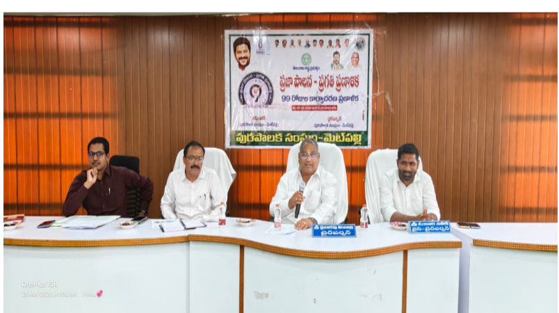
మెట్ పల్లి, మే 25

ఈరోజు మెట్ పల్లి పురపాలక సంఘ కార్యాలయ సమావేశ మందిరంలో కౌన్సిల్ సాధారణ సమావేశం జరిగినది.మెట్ పల్లి పురపాలక సంఘ కార్యాలయంలో గౌరవ చైర్ పర్సన్ అధ్యక్షతన ఈరోజు కౌన్సిల్ సాధారణ సమావేశం నిర్వహించడం జరిగినది. ఇట్టి సమావేశంలో (29) అంశాలను హిందుపరచగా అట్టి అంశాలను కౌన్సిల్ సభ్యులు ఆమోదం తెలిపినారు. అనంతరం గౌరవ కౌన్సిల్ సభ్యులు మాట్లాడుతూ అన్ని వార్డులలో అవసరం