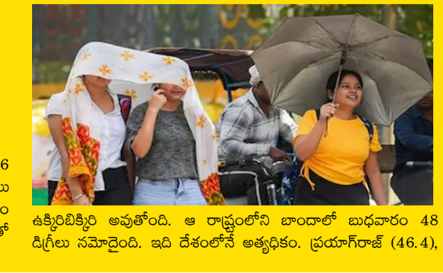
ఉక్కిరిబిక్కిరి అవుతోంది. ఆ రాష్ట్రంలోని బాందోల్ బుధవారం 48 డిగ్రీల సమాధియ్యాయి. ఇది దేశంలోనే అత్యధికం. ప్రయాగ్ లో (46.4),

హ్యూమిల్టీ, మే 21: డిగ్రీల సెల్సియస్ వద్ద సమాధియ్యాయి. గరిష్ఠం ఉష్ణోగ్రతలు 46 డిగ్రీలను చేరే పరిస్థితులు కనిపిస్తున్నాయి. ఢిల్లీలో ఈ స్థాయి ఉష్ణోగ్రతలు 14 ఏళ్ల తర్వాత ఇదే తొలిసారి. దీంతో భారత వాతావరణ విభాగం (ఐఎంఓ) ఆరెంజ్ అలర్ట్ జారీ చేసింది. ఇక యూపీ ఉష్ణోగ్రతతో