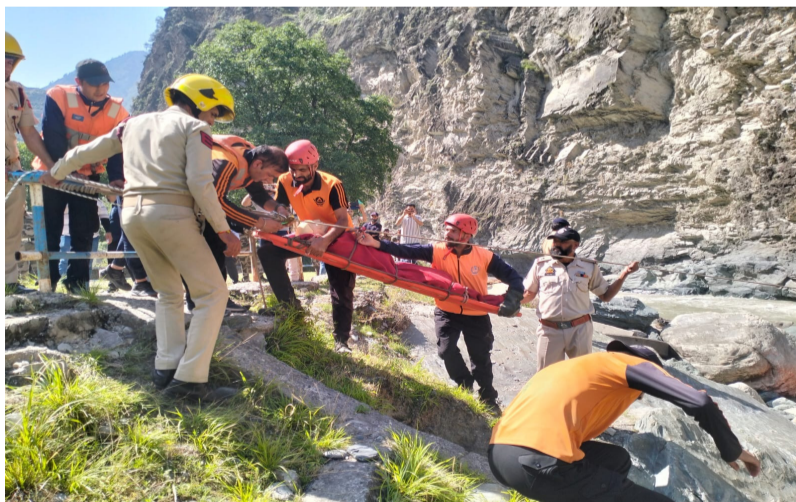
ఈ కార్యక్రమం ద్వారా స్పష్టమైందని అధికారులు పేర్కొన్నారు. విపత్తు సమయంలో సమాచార మార్పిడి, రక్షణ చర్యలు సమర్థంగా సాగేందుకు ఇలాంటి మాక్ డ్రిల్లు ఎంతో ఉపయోగపడతాయని తెలిపారు. విపత్తుల సమయంలో ప్రాణనష్టం తగ్గించడంతో పాటు ప్రజల భద్రతను మరింత బలోపేతం చేయడమే ఈ కార్యక్రమం లక్ష్యమని అధికారులు వెల్లడించారు. భవిష్యత్తులో కూడా ఇలాంటి సంయుక్త విన్యాసాలు కొనసాగనున్నాయని పేర్కొన్నారు.

విపత్తుల సమయంలో అత్యవసర పరిస్థితులను సమర్థంగా ఎదుర్కొనే లక్ష్యంతో కేంద్ర పారిశ్రామిక భద్రతా దళం ఆధ్వర్యంలో సంయుక్త మాక్ డ్రిల్ నిర్వహించారు. జమ్మూ కశ్మీర్ లోని దుల్ హన్జీ జలవిద్యుత్ ప్రాజెక్టు పరిధిలో ఈ విన్యాసాలు చేపట్టారు. ఆకస్మిక వరద పరిస్థితులను ఆధారంగా తీసుకొని అత్యవసర స్పందన వ్యవస్థలను పరీక్షించారు. ఫ్లాష్ వరదలు సంభవించిన పరిస్థితిని ఊహించి ముందస్తు హెచ్చరిక వ్యవస్థ ఆధారంగా ఈ మాక్ డ్రిల్ నిర్వహించారు. దుల్ కంపెనీ డ్యామ్ ప్రాంతంలో జరిగిన ఈ కార్యక్రమం ద్వారా విపత్తు సమయంలో వివిధ శాఖల మధ్య సమన్వయాన్ని పరీక్షించినట్లు అధికారులు తెలిపారు. ఈ కార్యక్రమంలో కేంద్ర పారిశ్రామిక భద్రతా దళం సిబ్బందితో పాటు రాష్ట్ర విపత్తు స్పందన దళం, జమ్మూ కశ్మీర్ పోలీసులు, భారత రెడ్ క్రాస్ సంఘం, జాతీయ జలవిద్యుత్ సంస్థ సిబ్బంది పాల్గొన్నారు. పలు విభాగాల ప్రతినిధులు సమన్వయంతో పనిచేస్తూ రక్షణ చర్యలను ప్రదర్శించారు. విపత్తు సమయంలో ప్రజలను సురక్షిత ప్రాంతాలకు తరలించడం, గాయపడిన వారికి వైద్య సహాయం అందించడం, అత్యవసర స్పందన చర్యలను వేగంగా చేపట్టడం వంటి అంశాలపై విన్యాసాలు నిర్వహించారు. ప్రమాద పరిస్థితుల్లో ఎంత వేగంగా స్పందించగలమనే అంశాన్ని పరిశీలించారు. వివిధ శాఖల మధ్య సమన్వయం ఎంత కీలకమో