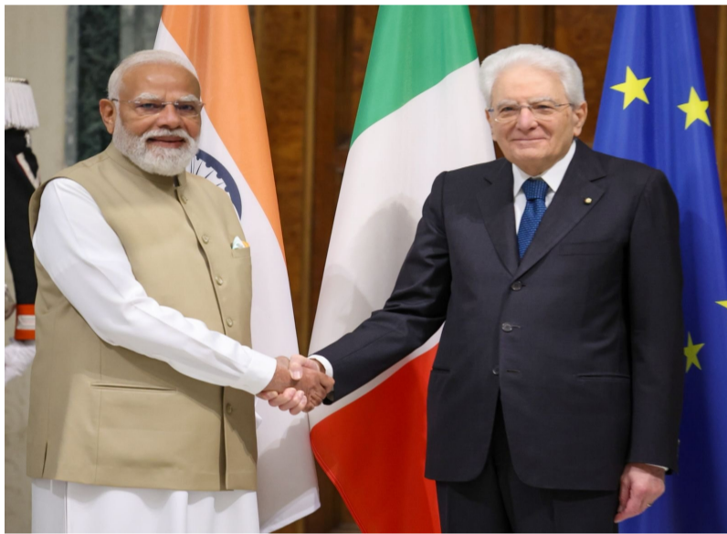
సమావేశం కూడా ఆ దిశగా మరో కీలక అడుగుగా భావిస్తున్నారు. ఇరు దేశాల మధ్య స్నేహబంధాన్ని మరింత ఉన్నత స్థాయికి తీసుకెళ్లేందుకు ఈ భేటీ ఉపయోగపడుతుందని రాజకీయ పరిశీలకులు అభిప్రాయపడుతున్నారు. రాజోయే రోజుల్లో పలు రంగాల్లో సహకారం మరింత విస్తరించే అవకాశాలు కనిపిస్తున్నాయని చెబుతున్నారు.

భారత ప్రధానమంత్రి నరేంద్ర మోదీ ఇటలీ పర్యటనలో భాగంగా ఇటలీ అధ్యక్షుడు సెర్గియో మట్టరెల్లాను రోమ్ లో కలిశారు. ఈ సందర్భంగా భారత్-ఇటలీ మధ్య ద్వైపాక్షిక సంబంధాలకు సంబంధించిన పలు కీలక అంశాలపై ఇరువురు నేతలు విస్తృతంగా చర్చించారు. ఇరు దేశాల మధ్య స్నేహ సంబంధాలను మరింత బలోపేతం చేసే దిశగా సమావేశం జరిగినట్లు సమాచారం. ముఖ్యంగా వాణిజ్యం, పెట్టుబడులు, సాంస్కృతిక సంబంధాలపై ప్రత్యేకంగా చర్చించినట్లు ప్రధాని మోదీ వెల్లడించారు. రెండు దేశాల మధ్య సహకారాన్ని మరింత విస్తరించేందుకు పలు అంశాలను పరిశీలించినట్లు తెలిపారు. ఆస్వాధునిక సాంకేతిక రంగాల్లో కూడా సహకారంపై చర్చలు జరిగాయి. కృత్రిమ మేధస్సు, కీలక ఖనిజాలు, అంతరిక్ష రంగం, అణుశక్తి వంటి వ్యూహాత్మక రంగాల్లో కలిసి పనిచేసే అవకాశాలపై అభిప్రాయాలు పంచుకున్నట్లు వెల్లడించారు. ప్రపంచవ్యాప్తంగా సాంకేతిక రంగంలో వేగంగా మార్పులు చోటుచేసుకుంటున్న నేపథ్యంలో పరస్పర భాగస్వామ్యం మరింత అవసరమని నేతలు భావించినట్లు తెలుస్తోంది. భవిష్యత్ అవసరాలకు అనుగుణంగా కొత్త భాగస్వామ్యాలకు మార్గం సుగమం చేసే అంశాలపై చర్చలు సాగినట్లు సమాచారం. ఇటీవలి కాలంలో భారత్-ఇటలీ మధ్య సంబంధాలు మరింత బలపడుతున్నాయి. వ్యాపారం, రక్షణ, సాంకేతిక రంగాల్లో ఇరు దేశాలు పరస్పర సహకారాన్ని పెంచుకుంటున్నాయి. ఈ