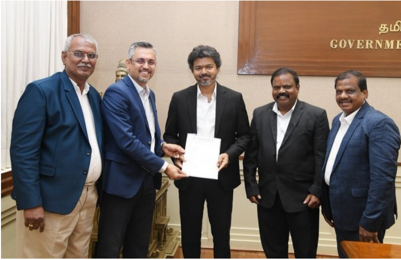
ద్వారా రాష్ట్ర ఆర్థిక వ్యవస్థ మరింత పురోగమిస్తుందని అధికారులు భావిస్తున్నారు. కొత్త పెట్టుబడులను ఆకర్షించడంతో పాటు స్థానిక పారిశ్రామిక వేతలకు అవకాశాలు కల్పించాల్సిన అవసరాన్ని కూడా సమావేశంలో ప్రస్తావించినట్లు సమాచారం. రాష్ట్రంలో పరిశ్రమల అభివృద్ధికి ప్రభుత్వం ప్రత్యేక ప్రాధాన్యం ఇస్తోందని, సూక్ష్మ, చిన్న పరిశ్రమల ప్రోత్సాహానికి తగిన చర్యలు తీసుకుంటామని ముఖ్యమంత్రి హామీ ఇచ్చినట్లు తెలుస్తోంది. పరిశ్రమల వృద్ధి ద్వారా ఉద్యోగ అవకాశాలు మరింత పెరుగుతాయని విశ్లేషకులు అభిప్రాయపడుతున్నారు.