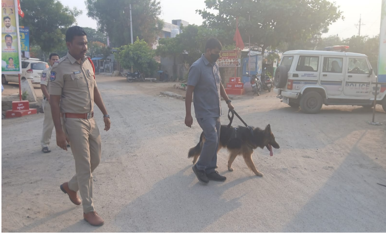
నార్కోటిక్ డాగ్స్ తో తనిఖీ చేస్తున్న దృశ్యం

హుస్సాబాద్ (అక్కన్నపేట), మే 19 అక్కన్నపేట పోలీస్ స్టేషన్ పరిధిలో గంజాయి, ఇతర మత్తు పదార్థాల నిర్మూలనకు ఎస్పి చాతరాజు ప్రశాంత్ అధ్యక్షతన పోలీసు సిబ్బంది మంగళవారం రోజున చర్యలు చేపట్టారు. గౌరవెల్లి గోవర్ధన్ గిరి గ్రామాలలో నార్కోటిక్ డాగ్స్ సహాయంతో ప్రత్యేక తనిఖీలు నిర్వహించారు. కిరాణి షాపులు టీ కొట్టులు పాన్ షాపులు, ఇతర అనుమానాస్పద ప్రాంతాలలో ఆకస్మిక తనిఖీలు చేపట్టి మత్తు పదార్థాలపై పటిష్ట నిఘా ఏర్పాటు