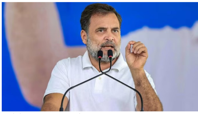
రామ్ జరేలి, 19 మే

ఆర్థిక సంక్షోభం వేళ విదేశీ పర్యటనలపై ప్రశ్నలు దేశానికి ఆర్థిక తుపాను ముప్పు ఉందంటూ హెచ్చరిక ప్రభుత్వ ఆర్థిక విధానాలపై తీవ్ర విమర్శలు