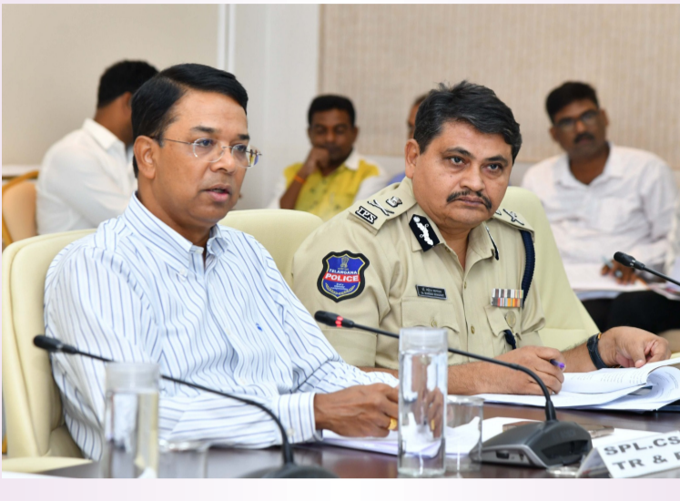
హైదరాబాద్, 19 మే :