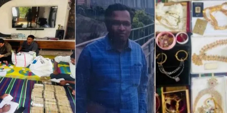
హైదరాబాద్, తారాక, మే 19:

ఇంట్లో కరెన్సీ నోట్ల గుట్టులు.. 2.1 కిలోల బంగారం, 9.2 కిలోల వెండి సంగారెడ్డి నిజామాబాద్ లో 18 ఎకరాల వ్యవసాయ భూమి