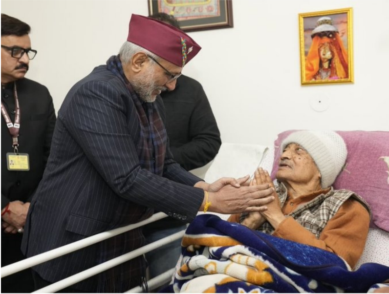
డెబ్రోడూన్, 19 మే

దేశం గొప్ప సైనికుడు, నిజాయితీ నాయకుడిని కోల్పోయిందన్న వ్యాఖ్య