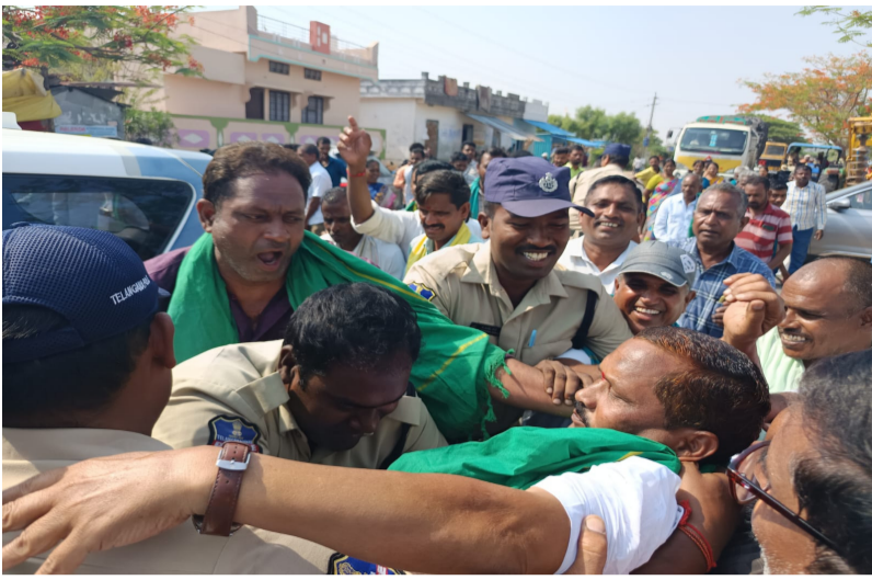
కథలాపూర్, మే 17

కథలాపూర్ మండలం చింతకుంట గ్రామానికి చెందిన రైతులు ఈరోజు కొర్రుట్ల నుండి వేములవాడ వెళ్లే రోడ్డుపై దుంపేట గ్రామం వద్ద కొనుగోలు జాప్యం పై ధర్మా చేశారు. వరి ధాన్యం కొనుగోలు రోజులు, నెలల తరబడి జాప్యం జరుగుతుందంటూ రైతులు మండిపడ్డారు.