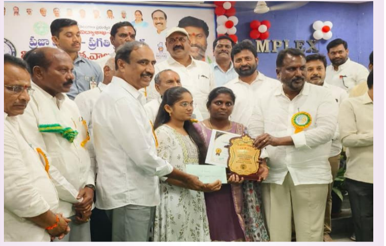
మల్కాల, మే, 17