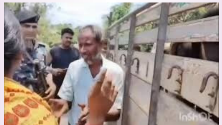
కోల్కతా, మే 17

బీజేపీ ఎమ్మెల్యే వ్యాఖ్యలపై రాజకీయ రచ్చ ఆవుల జనన ధృవీకరణ పత్రాలపై కొత్త వివాదం వ్యాఖ్యలను తీవ్రంగా తప్పుబట్టిన టీఎంసీ