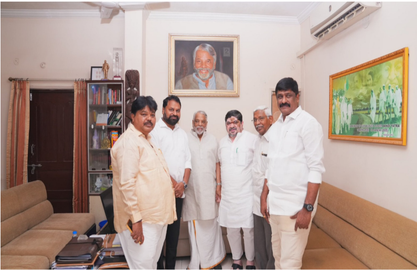
హైదరాబాద్, మే 17:

కేశవరావు నేతృత్వంలో కీలక చర్చలు ఉద్యమకారుల గుర్తింపుకు నాలుగు కేటగిరీల ప్రతిపాదనలు జిల్లాల వారీగా అభిప్రాయ సేకరణకు కమిటీ నిర్ణయం