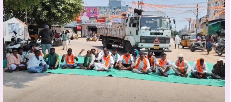
మల్కాల, మే 17

ధాన్యం కొనుగోళ్లలో జాప్యంపై నిరసిస్తూ మల్కాల మండల కేంద్రంలోని భారతమాత కూడలి వద్ద రైతులు ధర్మా నిర్వహించారు. గన్వి సంఘల కొరత, అధిక హామాలి ఖర్చు, లారీల కొరత, తూకంలో కటింగ్ వంటి సమస్యలతో పాటు ధాన్యం కొనుగోళ్లలో చాలా జాప్యం చేస్తున్నారని ఆవేదన చెందుతున్నారని ప్రభుత్వం, జిల్లా యంత్రంగం వెంటనే చర్యలు తీసుకొని రైతులకు న్యాయం చెయ్యాలని కోరుతున్నాను. కార్యక్రమంలో వివిధ గ్రామాల రైతులు పాల్గొన్నారు.