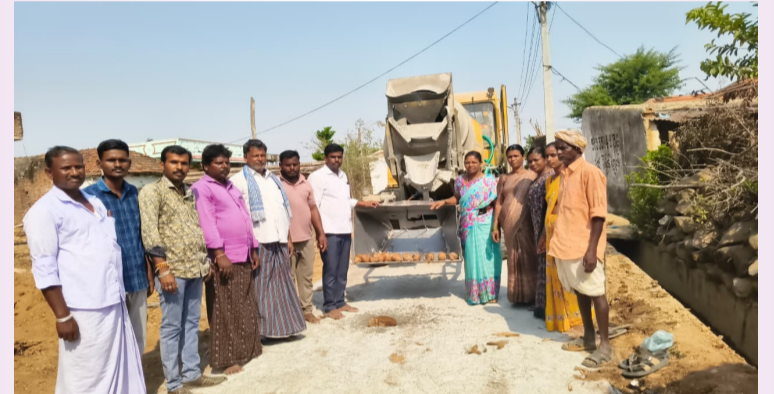
సీసీ రోడ్డు పనులు ప్రారంభిస్తున్న ధ్యక్షం