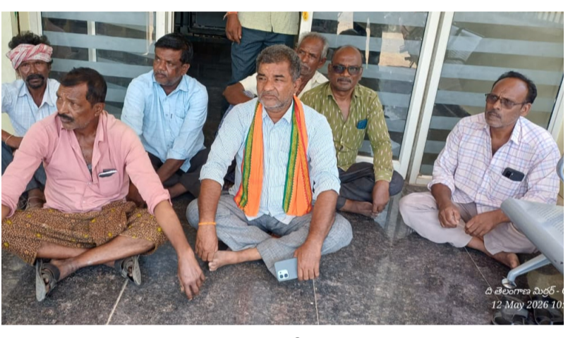
హుస్సాబాద్ బ్యాక్స్ కార్యాలయం ముందు కేబీ కాలనీ రైతుల బైరాయింపు

“సీఈవో రాకపోతే లేవం” అంటూ రైతుల బైరాయింపు