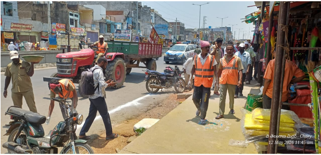
బార్డర్ వేస్తున్న మున్సిపల్ సిబ్బంది దృశ్యం

హుస్సాబాద్, మే 12 హుస్సాబాద్ పట్టణంలో ట్రాఫిక్ సమస్యలను తగ్గించి ప్రజలకు, వాహనదారులకు ఇబ్బందులు తలెత్తకుండా మంగళవారం పోలీసు శాఖ, మున్సిపల్ శాఖ అధికారులు సంయుక్తంగా ప్రత్యేక ట్రాఫిక్ క్లియరెన్స్ కార్యక్రమాన్ని చేపట్టారు. పట్టణంలోని అంబేద్కర్ చౌరస్తా నుంచి మల్లెచెట్టు