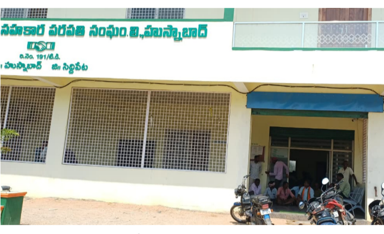
హుస్సాబాద్ లోని బ్యాక్స్ కార్యాలయం

హుస్సాబాద్, మే 12 హుస్సాబాద్ పట్టణంలోని కేబీ కాలనీ రైతుల సహాసం చివరకు ప్రాథమిక సహకార పరస్పర సహాయ సంఘం(ప్యాక్స్)కు చేరి ఆగ్రహంగా మారింది. తాము చెమటోడ్చి పండించిన వరి ధాన్యాన్ని కొనుగోలు కేంద్రంలో విక్రయించేందుకు 20 రోజులుగా ఎదురుచూస్తున్నా అధికారులు మాత్రం “ఇంకొంచెం ఆగండి” అన్న మాట తప్ప చర్యలు తీసుకోవడం లేదని రైతులు మండిపడ్డారు. ధాన్యం కొనుగోలు కాక ఎండలో ఆరబోసిన బియ్యం రోజురోజుకూ రంగు మారుతుంటే రైతుల ఆశలు కూడా అలాగే ఎండిపోతున్నాయని ఆవేదన వ్యక్తం చేశారు. “పండించిన ధాన్యం కంటే... ఎదురుచూపులే ఎక్కువయ్యాయి” అంటూ రైతులు వ్యంగ్యంగా వ్యాఖ్యానించారు. మంగళవారం స్థానిక వ్యవసాయ సహకార పరపతి సంఘం ప్యాక్స్ కార్యాలయం ఎదుట రైతులు బైరాయించి ఆందోళనకు దిగారు. “సీఈవో వస్తేనే లేస్తాం... హామీ ఇస్తేనే కదులుతాం” అంటూ భీష్మించుకుని కూర్చున్నారు. రైతుల ఆరోపణల