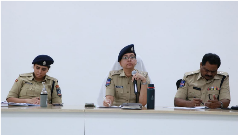
సమావేశంలో మాట్లాడుతున్న పోలీస్ కమిషనర్ సాధన రష్మీ పెరుమాళ్

- భద్రతా నిబంధనలు తప్పనిసరి - ఉల్లంఘిస్తే చట్టపరమైన చర్యలు - సిబ్బిపీట జిల్లా సీపీ సాధన రష్మీ పెరుమాళ్