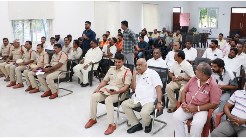
హాజరైన జిల్లాలోని వివిధ పోలీస్ ఠాణాల అధికారులు సిబ్బంది

సిబ్బిపీట, మే 11 నగరంలోని లాడ్జీలు, రిసార్ట్స్, హోటల్స్, ఫాంహౌస్లలో భద్రతా ప్రమాణాలను మరింత కట్టుదిట్టం చేయాలని పోలీస్ కమిషనర్ రష్మీ పెరుమాళ్, సుప్రం చేశారు. ప్రజల భద్రతే లక్ష్యంగా అన్ని వసతి కేంద్రాలు అప్రమత్తంగా వ్యవహరించాలని హెచ్చరిస్తూ యాజమాన్యాలు, మేనేజర్లతో సోమవారం ప్రత్యేక సమావేశం నిర్వహించారు. ఈ సందర్భంగా సీపీ పలు కీలక సూచనలు చేస్తూ, ప్రతి హోటల్, లాడ్జి, ఫాంహౌస్ ప్రవేశ ద్వారాల వద్ద డోర్ ఫ్రమ్ మెటల్ డిటెక్టర్, హ్యాండ్ హెల్డ్ మెటల్ డిటెక్టర్ ద్వారా తప్పనిసరిగా తనిఖీలు నిర్వహించాలని ఆదేశించారు. అనుమానాస్పద వ్యక్తుల రాకపోకలను నియంత్రించేందుకు నాణ్యమైన సీసీ కెమెరాలు ఏర్పాటు చేసి కనీసం 60 రోజుల వరకు వీడియో బ్యూకమ్ భద్రపరచాలని తెలిపారు. అత్యవసర పరిస్థితుల్లో సత్వర స్పందన కోసం ప్రత్యేక ప్రవేశ - నిష్క్రమణ గేట్లు, ఫైర్ ఎక్స్టింగ్విషర్లు ఏర్పాటు చేయడంతో పాటు ఫైర్ సేఫ్టీ ఆడిట్ నిర్వహించాలని సూచించారు. ఉద్యోగులకు ఫైర్ సేఫ్టీపై ప్రాథమిక శిక్షణ ఇవ్వాలని సుప్రం చేశారు. ఇతర రాష్ట్రాల నుంచి వచ్చే ఉద్యోగుల పూర్తి వివరాలను కచ్చితంగా