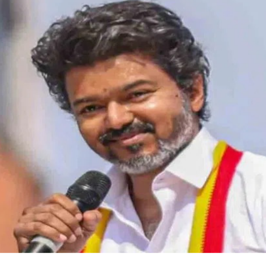
స్పష్టం చేశారు. తమ ఏకైక ఎమ్మెల్యే కనిపించడం లేదని, ఆయనను రాజకీయ ప్రలోభాలకు గురిచేసే ప్రయత్నాలు జరుగుతున్నాయని దినకరన్ ఆరోపించారు. ఈ వ్యవహారంపై పోలీసులకు ఫిర్యాదు చేస్తామని ప్రకటించిన ఆయన, గిండి రేంజ్ ఏసీబీ కార్యాలయానికి వెళ్లి అధికారికంగా ఫిర్యాదు చేశారు. మరోవైపు టీవీకే మాత్రం దినకరన్ ఆరోపణలను ఖండించింది. తాము ఎవరితోనూ బేరసారాలు చేయాల్సిన అవసరం