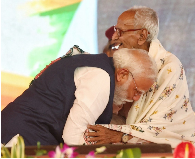
నాయకత్వం వెల్లడిస్తోంది. ప్రమాణ స్వీకార కార్యక్రమానికి పెద్ద సంఖ్యలో పార్టీ కార్యకర్తలు, నాయకులు హాజరయ్యారు. బెంగాల్ రాజకీయాల్లో ఈ పరిణామం కొత్త మార్పులకు దారితీస్తుందని రాజకీయ వర్గాలు భావిస్తున్నాయి.