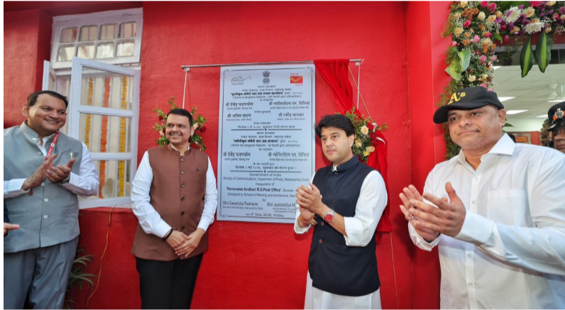
ప్రజలకు సమర్థవంతమైన సేవలు అందించేందుకు తపాలా వ్యవస్థను మరింత బలోపేతం చేస్తున్నట్లు తెలిపారు. ముఖ్యమంత్రి ఫడ్నవీస్ మాట్లాడుతూ, ఆధునికీకరించిన పోస్టాఫీసులు ప్రజలకు సమయపాలనతో కూడిన సేవలు అందించడంలో కీలక పాత్ర పోషిస్తాయని పేర్కొన్నారు. డిజిటల్ యుగానికి అనుగుణంగా ప్రభుత్వ సేవలను ప్రజలకు చేరవేయడంలో ఇటువంటి కేంద్రాలు ఉపయోగపడతాయని అన్నారు. ఈ కార్యక్రమంలో తపాలా శాఖ ఉన్నతాధికారులు, ప్రజాప్రతినిధులు పాల్గొన్నారు. దేశవ్యాప్తంగా పోస్టల్ సేవల ఆధునికీకరణకు జన సేవా కనెక్ట్ కార్యక్రమం కొత్త దిశనిరేఖం చేస్తోందని అధికారులు అభిప్రాయపడ్డారు.

కేంద్ర మంత్రి జ్యోతిరాదిత్య సింధియా, మహారాష్ట్ర ముఖ్యమంత్రి దేవేంద్ర ఫడ్నవీస్ ముంబైలోని అంధేరి రైల్వే స్టేషన్ పోస్టాఫీసును ఆధునికీకరించిన “ఫ్యూచర్ రెడీ పోస్టాఫీసు”గా ప్రారంభించారు. తపాలా శాఖ ప్రతిష్ఠాత్మకంగా అమలు చేస్తున్న “జన సేవా కనెక్ట్” కార్యక్రమంలో భాగంగా ఈ కేంద్రాన్ని అభివృద్ధి చేశారు. అంధేరి రైల్వే స్టేషన్ పోస్టాఫీసు మహారాష్ట్రలో తొలి జన సేవా కనెక్ట్ పోస్టాఫీసుగా నిలవగా, దేశవ్యాప్తంగా ఈ కార్యక్రమంలో ప్రారంభమైన రెండో పోస్టాఫీసుగా గుర్తింపు పొందింది. ప్రజలకు వేగవంతమైన, సాంకేతిక ఆధారిత సేవలు అందించడమే ఈ ప్రాజెక్టు ప్రధాన లక్ష్యంగా అధికారులు తెలిపారు. దేశంలోని 17 రాష్ట్రాల్లో ఎంపిక చేసిన 40 పోస్టాఫీసుల్లో ప్రయోగాత్మకంగా ఈ ప్రాజెక్టును అమలు చేస్తున్నారు. పోస్టాఫీసులను ఆధునికీకరించడం అనుగుణంగా మార్చి ప్రజలకు మరింత మెరుగైన సేవలు అందించేందుకు కేంద్ర ప్రభుత్వం చర్యలు చేపడుతోంది. ఈ సందర్భంగా కేంద్ర మంత్రి సింధియా మాట్లాడుతూ, పోస్టల్ సేవలను డిజిటల్ సాంకేతికతతో అనుసంధానం చేసి ప్రజలకు సులభమైన సేవలు అందించడంపై ప్రభుత్వం దృష్టి పెట్టిందన్నారు. గ్రామీణ, పట్టణ ప్రాంతాల