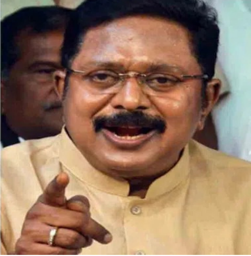
లేదని స్పష్టం చేసింది. తమపై తప్పుడు ప్రచారం జరుగుతోందని ఆరోపించింది. ఈ పరిణామాల మధ్య దినకరన్ మరో కీలక అడుగు వేశారు. తమ ఎమ్మెల్యే కామరాజ్ తో కలిసి గవర్నర్ రాజేంద్ర విశ్వనాథ్ ఆర్డర్ కర్ను కలిసి, ఎడప్పాడి కే పళనిస్వామి నేతృత్వంలోని ప్రభుత్వానికి మద్దతు ఇస్తామని తెలిపారు. దీంతో తమిళనాడు రాజకీయాల్లో పరిస్థితులు మరింత ఆసక్తికరంగా మారాయి.