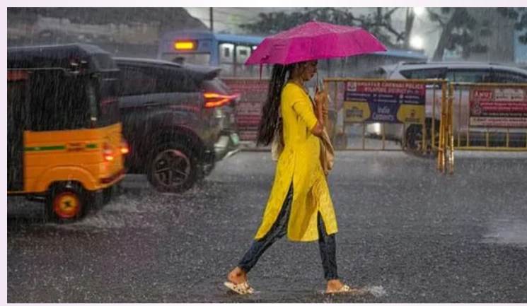
న్యూఢిల్లీ, మే 8:

ఈ నెల 20వ తేదీ నాటికి నైరుతి రుతుపవనాలు అండమాన్ నికోబార్ దీవులను తాకొచ్చని భారత వాతావరణ విభాగం (ఐఎండీ) అంచనా వేసింది. రెండవ వారం చివరకు దక్షిణ బంగాళాఖాతం, అండమాన్ సముద్రం, అండమాన్ నికోబార్ దీవులలోని కొన్ని ప్రాంతాల్లో రుతుపవనాల ప్రవేశం జరిగే అవకాశం ఉందని పేర్కొంది. ఈ ఏడాది రుతుపవన సీజన్ (జూన్-సెప్టెంబరు)లో సాధారణం కంటే తక్కువ వర్షపాతం నమోదయ్యే అవకాశం ఉందని, ఇది దీర్ఘకాల సగటు (ఎల్ పీఎ)లో 92 శాతంగా ఉంటుందని ఐఎండీ ఇంతకు ముందటి అంచనాల్లో పేర్కొంది. ఈ నేపథ్యంలో ప్రధాన పంటల నాట్లు వేసే కాలంలో పప్పుధాన్యాలు, నూనెగింజలు ఉత్పత్తిపై ప్రభావం చూపే అవకాశం ఉందనే అందోళనలు వ్యక్తమవుతున్నాయి. ఈ పరిణామం వినియోగం, ద్రవ్యోల్బణంపై ప్రభావం చూపే అవకాశం ఉంది. కాగా, బంగాళాఖాతం నుంచి ఈశాన్య భారతదేశం వరకు దిగువ, మధ్య ట్రోపోస్ఫిరిక్ స్థాయిల్లో ఈ వారంలో నైరుతి గాలులు వీచే అవకాశం ఉందని ఐఎండీ తెలిపింది. మొత్తంగా.. దక్షిణాది రాష్ట్రాలు, తూర్పు, ఈశాన్య భారతంలో సాధారణం కంటే అధిక వర్షపాతం, పశ్చిమ హిమాలయన్ రిజియన్ లో సాధారణం కంటే తక్కువ, దేశంలోని మిగతా చోట్ల దాదాపు సాధారణ వానలు పడతాయని వాతావరణ శాఖ తెలిపింది. రైతులు కీలకమైన ఖరీఫ్ సీజన్ లో వరి, పత్తి, పప్పుధాన్యాలు, నూనెగింజలు వంటి పంటలను సాగు చేస్తారు. ఈ క్రమంలో నైరుతి వర్షపాత విస్తరణ, వానలు పడే సమయం అనేవి చాలా కీలకం.