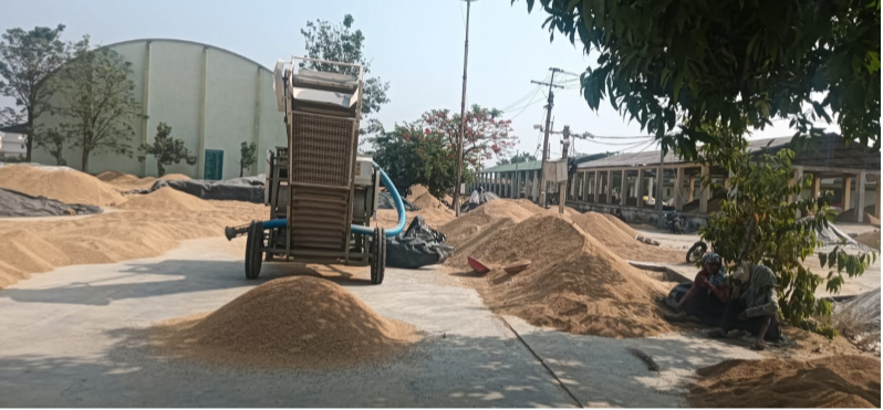
ధాన్యం క్లీన్ చేసే మిషన్

బ్రేకర్లు పడిపోతే రైతులకు పెరుగుతున్న కష్టాలు!