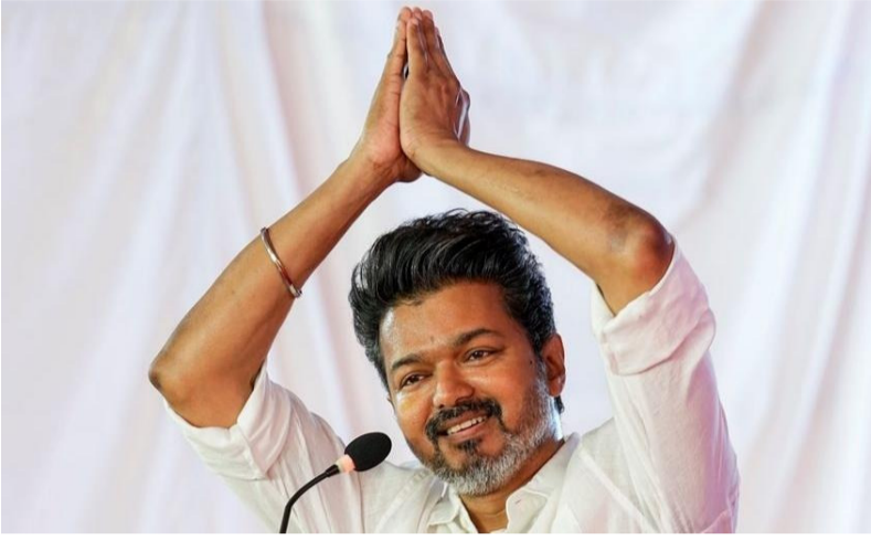
ఓటర్లను ఆకట్టుకున్న విజయ్ వ్యక్తిత్వం

విజయ్ కు ఉన్న భారీ ఫ్యాన్ బేస్ ఈ ఎన్నికల్లో ప్రధాన బలం అయింది. సంవత్సరాలుగా సేవా కార్యక్రమాలు నిర్వహిస్తున్న విజయ్ మక్కల్ ఇయక్కం క్రమంగా శక్తిమంతమైన రాజకీయ క్యాడర్ గా మారింది. రక్తదాన శిబిరాలు, విద్యా సహాయం, వివక్షల సమయంలో సహాయక చర్యలు వంటి కార్యక్రమాలు ప్రజల్లో విశ్వాసాన్ని పెంచాయి. యువత మద్దతు డీఎంకే విజయానికి కీలకం. మొదటిసారి ఓటు వేసిన యువత పెద్దఎత్తున విజయ్ కు మద్దతు తెలిపారు. ఉద్యోగ అవకాశాలు, విద్యా సంస్కరణలు, పౌరదర్శక పరీక్షా విధానం వంటి హామీలు వారికి ఆకర్షణీయంగా మారాయి. మహిళల కోసం ప్రత్యేక సంక్షేమ పథకాలు కూడా సైలెంట్ ఓటును డీఎంకే వైపు మళ్లించాయి.