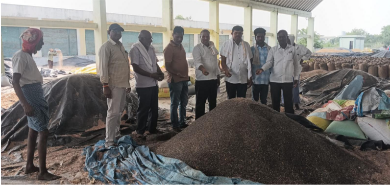
ఏఎస్లో పొద్దు తిరుగుడు గింజలను పరిశీలిస్తున్న ధ్యక్షం