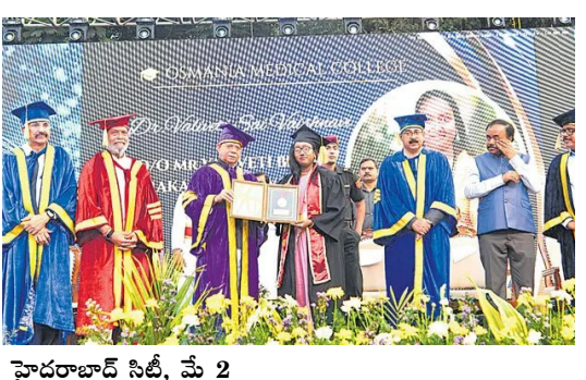
హైదరాబాద్ సీటీ, మే 2 : ఆరోగ్య రంగంలో వేగంగా వస్తున్న మార్పులకు అనుగుణంగా