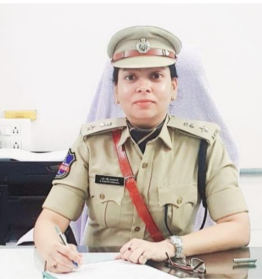
మాట్లాడుతున్న సిద్దిపేట పోలీస్ కమిషనర్ రమ్మి పెరుమాళ్ (ఫైర్ ఫోలో)

తనిఖీలు కఠినతరం చేయనున్నట్లు తెలిపారు. అక్రమంగా జంతువుల రవాణా, వధలను అరికట్టేందుకు ప్రత్యేక నిఘా బలగాలను రంగం లోకి దింపుతున్నారు. పోలీస్ స్టేషన్లకు గస్తీ పెంచాలని, పురపాలక మరియు పశువైద్య శాఖలతో సమన్వయం కలిగి పనిచేయాలని ఆదేశాలు జారీ అయ్యాయి. ఈ సమావేశానికి ట్రైని ఐపీఎస్ అయ్యే షాతిమా, అదనపు డీసీపీ అడ్వీన్ ఖుషాల్కర్, ఏసీపీ రవీందర్ రెడ్డి హాజరయ్యారు. పౌరులకు పోలీసుల కఠిన హెచ్చరిక పండుగను శాంతియుతంగా జరుపుకోవాలని, చట్టాలను అతిక్రమిస్తే కఠిన చర్యలు తప్పవని పోలీసులు స్పష్టం చేశారు. అనుమానాస్పద కార్యకలాపాలు గమనించిన వెంటనే 100 లేదా 112 సంబంధిత సమాచారం అందించాలని సూచించారు. సామరస్యమే ప్రధాన లక్ష్యం: