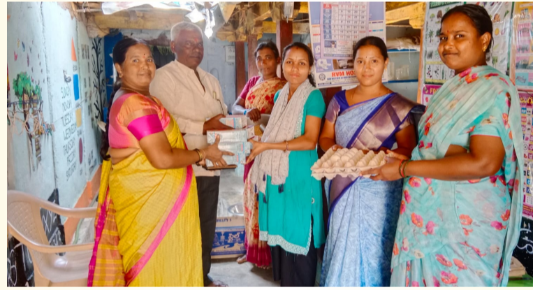
పోషకాహారం పంపిణీ చేస్తున్న ధ్యక్షం