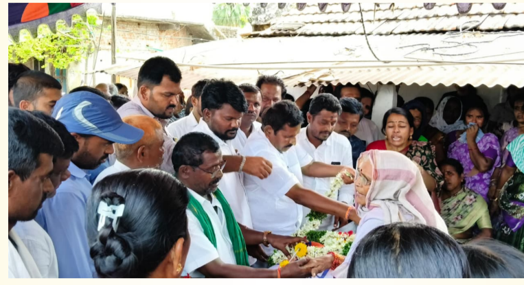
మృతదేహానికి నివాళులర్పిస్తున్న నాయకుల ధ్యక్షం