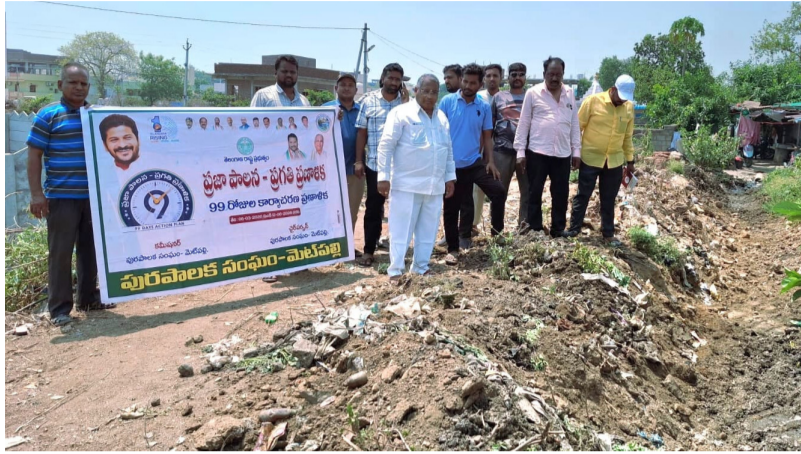
మెట్ పల్లి, ఏప్రిల్ 17