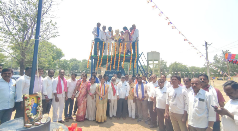
రామకృష్ణపూర్, ఏప్రిల్ 14, (మన సమాజం): అంబేద్కర్ ఆశయా సాధనకు ప్రతి ఒక్కరు కృషి చేయాలని మున్సిపల్ చైర్మన్