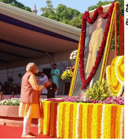
న్యూఢిల్లీ, ఏప్రిల్ 14 భారత రాజ్యాంగ నిర్మాత, భారతరత్న డాక్టర్ బాబాసాహెబ్ అంబేద్కర్ జయంతి వేడుకలు

అంబేద్కర్ ఆశయాలు దేశానికి నిరంతర ప్రేరణాత్మకం ప్రేరణా స్థల వద్ద ప్రధాని, ఖర్గ్ ఆశ్రిత్యు పలకరింపు ప్రగతిశీల సమాజ నిర్మాణం కోసం బాబాసాహెబ్ కృషి అనన్యం