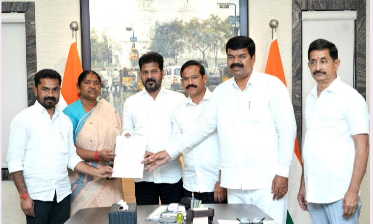
హైదరాబాద్, ఏప్రిల్ 13