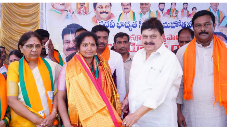
ఖానాపూర్, ఏప్రిల్ 13 :

- డీలిమిటేషన్ పై అపోహలు సృష్టిస్తున్నారంటూ విమర్శలు - నూతన ఛైర్పర్సన్ కు శుభాకాంక్షలు - బీజేపీ రాష్ట్ర అధ్యక్షులు