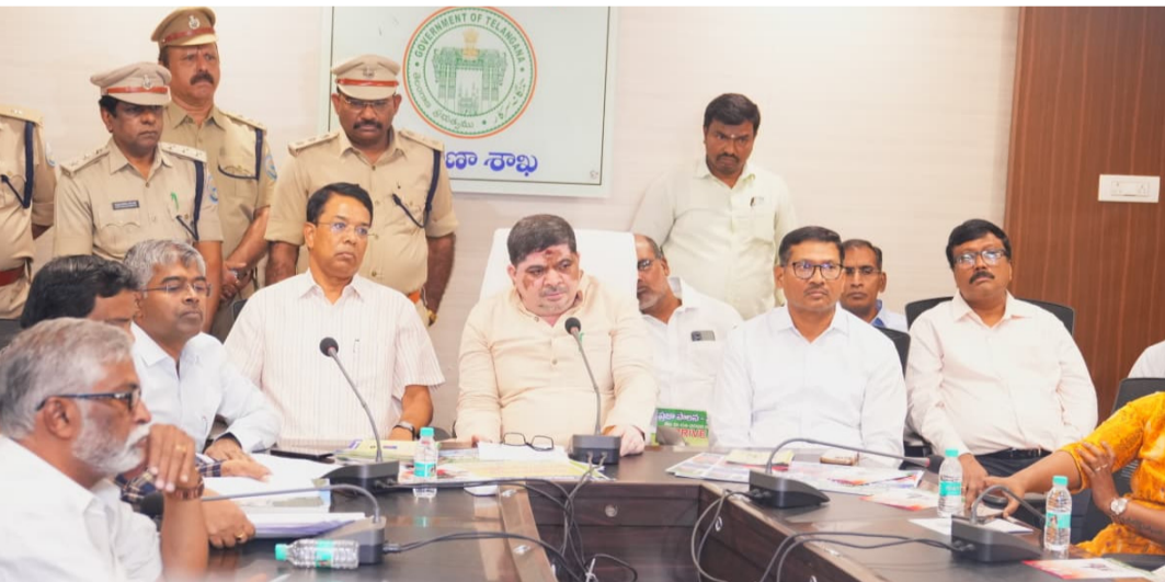
హైదరాబాద్, ఏప్రిల్ 13

- గోల్డెన్ అవర్ సేవలకు 'రహవీర్ అవార్డ్' - ట్రాఫిక్ నియమాల అమలుపై కట్టుదిట్ట చర్యలు