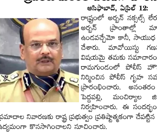
రోడ్డు ప్రమాదాల నియంత్రణకు 'అరెస్ట్ అలైవ్'