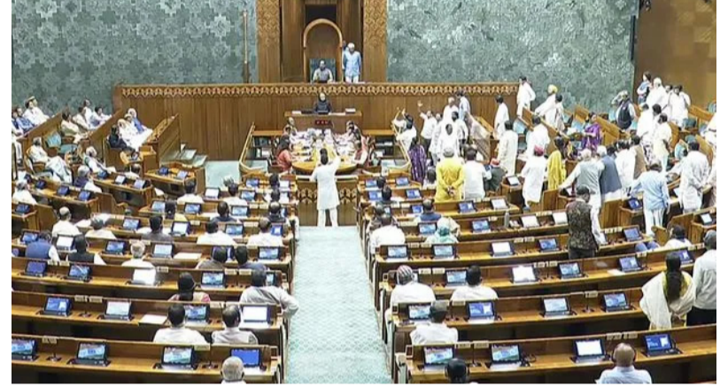
హైదరాబాద్, ఏప్రిల్ 12

డివిమెట్ పార్టీ అభ్యంతరాలుండవు. కేటీఆర్ డివిమెట్ పార్టీ వల్ల రాష్ట్రంలో అసెంబ్లీ, పార్లమెంటు స్థానాలు పెరుగుతాయని, దీంతో బీఆర్ఎస్ కు భవిష్యత్తులో మరిన్ని అవకాశాలు వస్తాయని కేటీఆర్ మీడియాతో చిట్-చాట్లో అన్నారు. ప్రస్తుతం ఉన్న నిష్పత్తి ప్రకారం డివిమెట్ చేపడితే ఎవరికి అభ్యంతరాలు ఉండవచ్చు. పార్లమెంటులో ప్రస్తుతం ఎంపీ స్థానాల్లో దక్షిణాది రాష్ట్రాలకు 24 శాతం వాటా ఉందని, ఇకపైనూ ఈ శాతం తగ్గకుండా డివిమెట్ చేపట్టాలన్నారు. రాజీయే ఎన్నికల్లో తాము ఎవరితోనూ పొత్తు పెట్టుకోలేమని తెలిపారు. ఎట్టిపరిస్థితుల్లోనూ బీజేపీతో కలిసి పోటీ చేయబోమని, బీఆర్ఎస్ ఒంటరిగానే బరిలోకి దిగుతుందని స్పష్టం చేశారు. పొత్తులు తమకు కలిసిరావచ్చు. గోదావరి పరివాహక ప్రాంతంలో ఎమ్మెల్యే అభ్యర్థులను మార్చగలిగితే తిరిగి అధికారంలోకి వచ్చే అవకాశాలున్నాయని పేర్కొన్నారు.