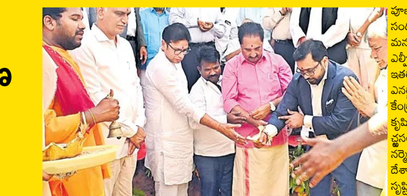
సమన్వయం చేయాలన్నదే తమ లక్ష్యమన్నారు. సిద్దిపేట జిల్లా నుంగంనూరు మండలం సర్కులర్ 'జూన్ షోర్' బయో ఫ్యూయల్ ప్రైవేట్ లిమిటెడ్ అధ్యక్షులతో రూ.700 కోట్ల పెట్టుబడితో ఏర్పాటు చేయనున్న కంప్లెక్స్ బయో గ్యాస్ (సీబీజీ) ప్రాజెక్టు ఆదివారం నిర్వహించిన భూమి

'క్లీన్ ఎనర్జీ'లో రోల్ మోడర్నగా తెలంగాణ సర్కులర్ ఎకానమీతో గ్రామీణ ఆర్థిక వ్యవస్థ బలోపేతం రూ.700 కోట్లతో నర్సేట్లలో కంప్లెక్స్ బయో గ్యాస్ ప్రాజెక్ట్ 1400 మందికి ఉపాధి కల్పన భూమి పూజాలో మంత్రి శ్రీధర్ బాబు హైదరాబాద్, ఏప్రిల్ 12: క్లీన్ ఎనర్జీలో తెలంగాణను దేశంలోని ఇతర రాష్ట్రాలకు రోల్ మోడల్ గా నిలిపేలా ప్రత్యేక కార్యాచరణతో కృషి చేస్తున్నామని బీజేపీ, పరిశ్రమల శాఖ మంత్రి దుద్దిళ్ల శ్రీధర్ బాబు పేర్కొన్నారు. సర్కులర్ ఎకానమీని ప్రోత్సహించడం ద్వారా పారిశ్రామిక వృద్ధిని, పర్యావరణ పరిరక్షణను