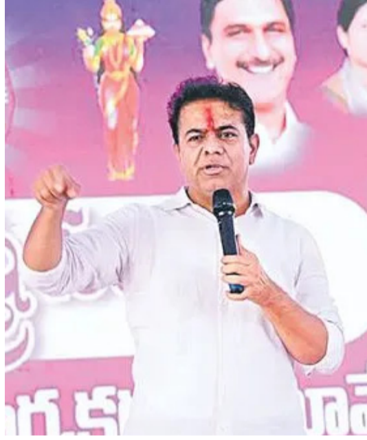
ఎంక్వెర్టులు వేయాలని డిమాండ్ చేశారు.

రాజకీయాలు చేశామని, ఇకపై కార్యకర్తలను కేంద్రంగా చేసుకుని రాజకీయాలు చేస్తామని ప్రకటించారు. జర్నలిస్టుల సమస్యలపై స్పందిస్తూ.. వారికి తాము కూడా పూర్తిగా న్యాయం చేయలేకపోయాం ఉండవచ్చునని, అన్నీ చేశామని కూడా తాము చెప్పడం లేదని అన్నారు. వచ్చే ఎన్నికల్లో బీఆర్ఎస్ మేనిఫెస్టోలో పెట్టడం ద్వారా జర్నలిస్టుల సమస్యల పరిష్కారానికి కృషి చేస్తామని తెలిపారు. ప్రజా సమస్యలపై తాము 2027లో పాదయాత్ర చేపడతామని కేటీఆర్ ప్రకటించారు. వచ్చే కాలంలో పార్టీకి, ప్రజలకు మధ్య దూరం పెరిగిందని, దానిని తగ్గించేందుకు అన్నివిధాలా ప్రయత్నిస్తామని చెప్పారు. బీఆర్ఎస్ ప్రభుత్వ హయాంలో జరిగిన కొన్ని లోపాలను కేటీఆర్ బహిరంగంగానే అంగీకరించారు గుర్తు చేశారు. క్షేత్రస్థాయిలో పార్టీ కార్యకర్తలు, సర్పంచులు, ఎంపీటీసీలు, మండల స్థాయి నాయకత్వాన్ని సమన్వయం చేసుకోవడంలో తాము విఫలమయ్యామన్నారు. కరీంనగర్, నిజామాబాద్, ఆదిలాబాద్ జిల్లాల నుంచి లక్షలాది మంది కార్మికులు గల్ఫ్ దేశాల్లో ఉన్నప్పటికీ, వారి ప్రయోజనాల కోసం సరైన 'గల్ఫ్ పాలసీ'ని తీసుకురాలేకపోయామని పేర్కొన్నారు. అభివృద్ధి, సంక్షేమం లక్ష్యంగా కొన్ని రంగాలకు అత్యధిక ప్రాధాన్యం ఇవ్వడంతో కాంట్రీ లోపాలనే తీర్చాలన్నాడు.