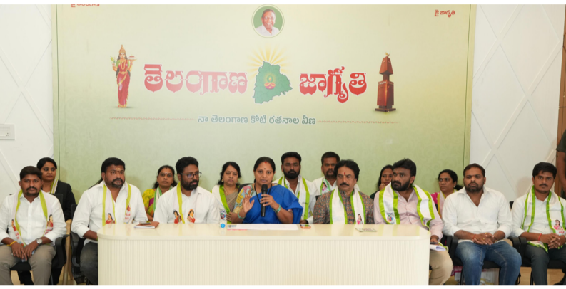
హైదరాబాద్, ఏప్రిల్ 10

స్టేట్ హైనాన్సియల్ కోడ్ కు విరుద్ధంగా వ్యవహరిస్తున్నారని ఆరోపణ