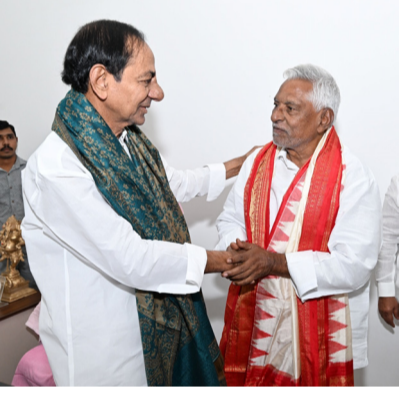
హైదరాబాద్, ఏప్రిల్ 10

జగిత్యాల రాజకీయాల్లో సలకాత్త సమీకరణాలకు వేదికైన మర్యాదపూర్వక భేటీ