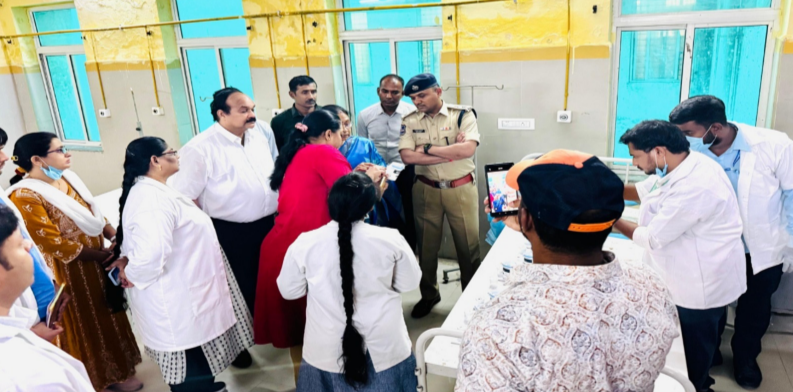
హైదరాబాద్, ఏప్రిల్ 10

హైదరాబాద్ సిటీ పోలీస్ మెరుపు తనిఖీలు - హెచ్-స్యా, టాస్క్ ఫోర్స్ ఆధ్వర్యంలో 239 మందికి వైద్య పరీక్షలు పరీక్షల్లో 189 మందికి డ్రగ్స్ అలవాటు ఉన్నట్లు నిర్ధారణ - మాదకద్రవ్యాల నిర్మూలనే లక్ష్యంగా కమిషనర్ ఆదేశాలతో ప్రత్యేక డ్రైవ్