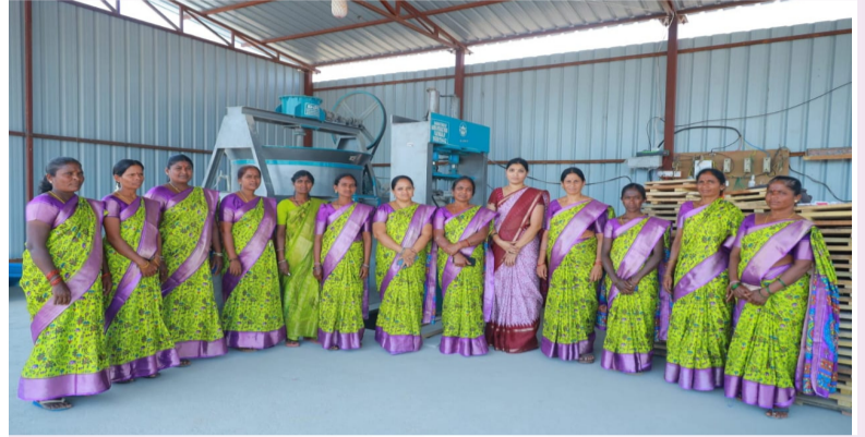
హైదరాబాద్, ఏప్రిల్ 10

- గృహ నిర్మాణానికి స్థానికంగా ఇటుకల సరఫరా