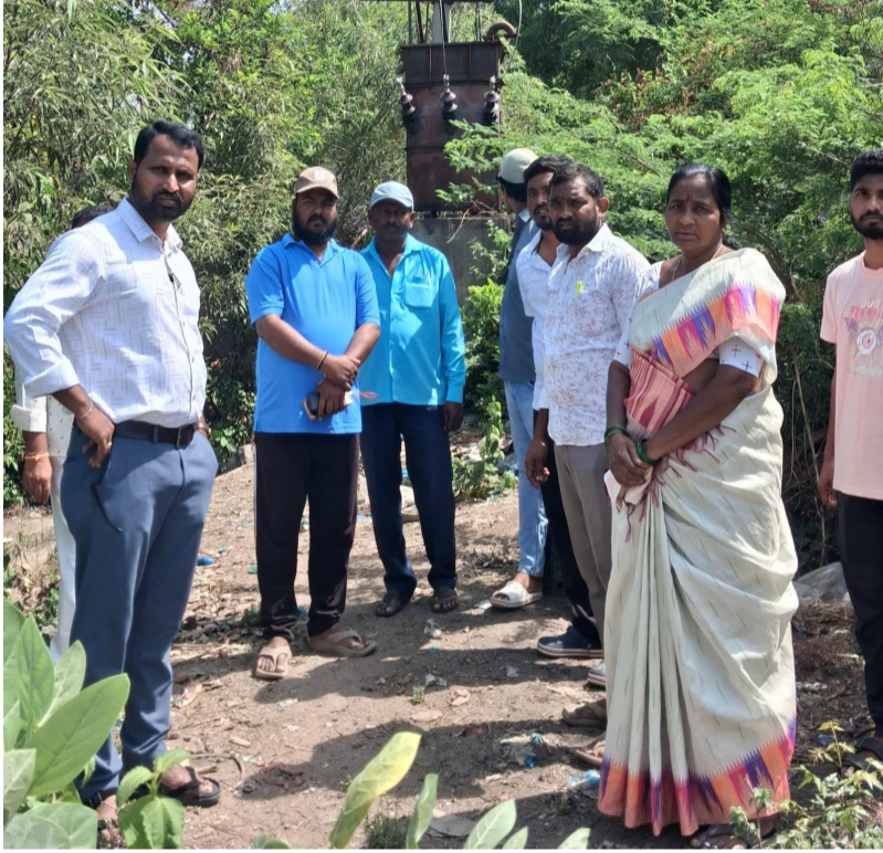
బెల్లంపల్లి ఏప్రిల్ 4 మన సమాజం బెల్లంపల్లి పట్టణంలోని 15 వ వార్డు టేకులబస్టి లో మున్సిపల్ కమిషనర్