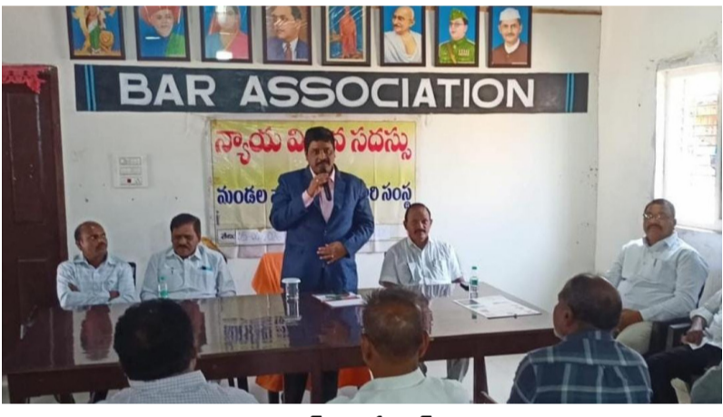
మెట్పల్లి, ఏప్రిల్ 5