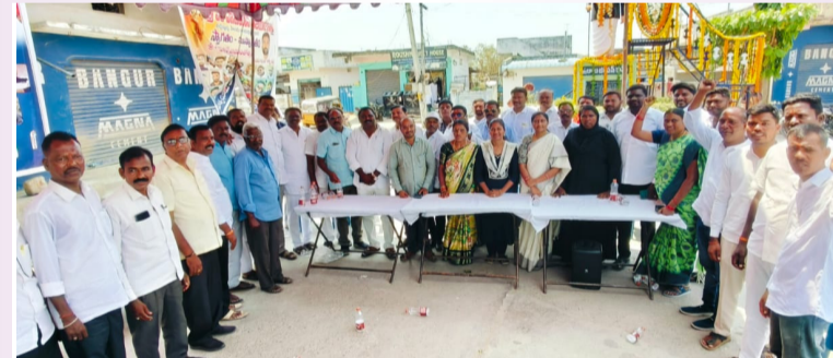
కోరుట్ల టౌన్ ఏప్రిల్ 05

కోరుట్ల పట్టణంలోని అంబేద్కర్ నగర్లో బాబు జగ్జీవన్ రామ్ జయంతి వేడుకలు ఘనంగా, వైభవంగా నిర్వహించారు. ఈ కార్యక్రమంలో స్థానిక ప్రజాప్రతినిధులు, నాయకులు సామాజిక కార్యకర్తలు, యువకులు, మహిళలు మరియు పెద్ద సంఖ్యలో కాలనీ నివాసితులు పాల్గొని వేడుకలను విజయవంతం చేశారు. ముందుగా బాబు జగ్జీవన్ రామ్ విగ్రహానికి పూలమాలలు వేసి ఘనంగా నివాళులు అర్పించారు. అనంతరం జరిగిన సభలో వక్తలు మాట్లాడుతూ ఆయన స్వాతంత్ర్య సమరయోధుడిగా, దేశ రాజకీయాల్లో కీలక పాత్ర పోషించిన మహానేతగా కొనియాడారు. ముఖ్యంగా పేదలు, దళితుల అభ్యున్నతికి ఆయన చేసిన కృషిని గుర్తు చేశారు. సమానత్వం, సామాజిక న్యాయం కోసం ఆయన చేసిన పోరాటం ప్రతి ఒక్కరికీ స్ఫూర్తిగా నిలుస్తుందని పేర్కొన్నారు. యువత ఆయన ఆలోచనలు, సిద్ధాంతాలను ఆదర్శంగా తీసుకొని సమాజ అభివృద్ధికి కృషి చేయాలని పిలుపునిచ్చారు. అలాగే విద్య, ఐక్యత, క్రమశిక్షణ ద్వారా ముందుకు సాగాలని సూచించారు. ఈ సందర్భంగా సాంస్కృతిక కార్యక్రమాలు కూడా నిర్వహించి, దేశభక్తి గీతాలు, ప్రసంగాలతో ఆకట్టుకున్నారు. మొత్తంగా అంబేద్కర్ నగర్లో జరిగిన ఈ జయంతి వేడుకకు మున్సిపల్ కమిషనర్ అన్ని పార్టీల నాయకులు సంగ అభ్యర్థులు, వార్డు ప్రజలు పాల్గొని ఇట్టి కార్యక్రమాన్ని ఉత్సాహభరిత తంగా, శాంతియుత వాతావరణంలో జరిగి, స్థానికంగా మంచి స్పందనను పొందాయి.