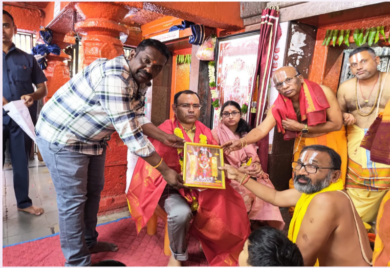
మల్లాల, ఏప్రిల్ 05