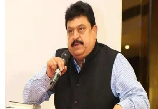
సౌకర్యం కల్పిస్తామని చెప్పి, డౌక్కు బస్సులను నడపడం వల్ల ఆర్థిక వ్యవస్థ కుప్పకూలిందని విమర్శించారు.