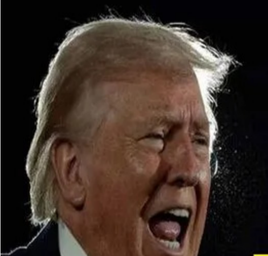
వాషింగ్టన్/న్యూఢిల్లీ, ఏప్రిల్ 5:

వెంటనే జలసంధిని తెరవకపోతే నరకంలో జీవించాల్సి వస్తుంది బహ్రాయిన్, సాబీ, యూఫకలోని చమురు, ఇంధన వ్యవస్థలపై దాడులు మా మౌలిక సదుపాయాలపై దాడులకు ప్రతీకారంగానే: ఐఆర్ జీసీ