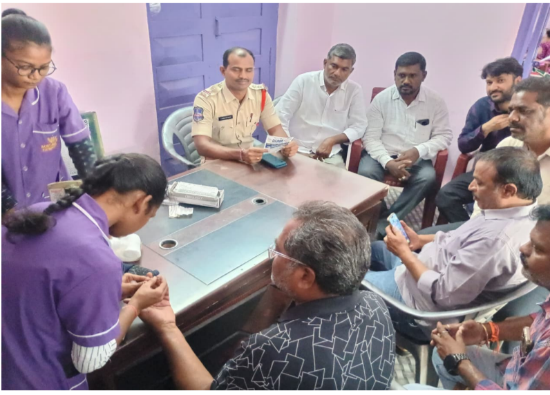
మేడిపల్లి, ఏప్రిల్ 05 :