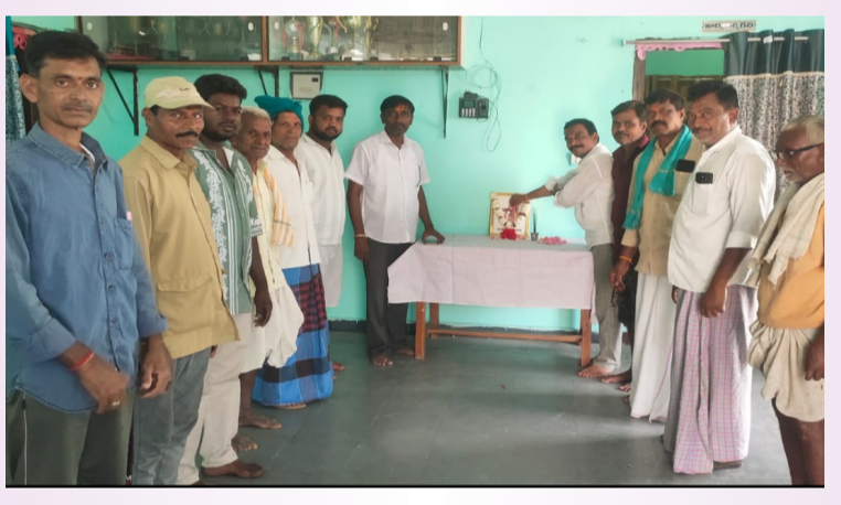
మెట్పల్లి, ఏప్రిల్ 5