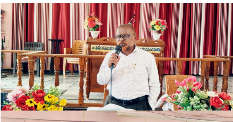
కథలాపూర్ ఏప్రిల్ 05

నేడు ప్రపంచవ్యాప్తంగా ఉన్న క్రైస్తవ సోదరులు ఒక ప్రత్యేకమైన రోజును గొప్ప పండుగల 41 రోజుల ఉపవాస ప్రార్థన రోజులకు ముగింపు పలుకుతూ ఈరోజును యేసుక్రీస్తు ల వారి పునరుత్థానం అనగా మరణించి